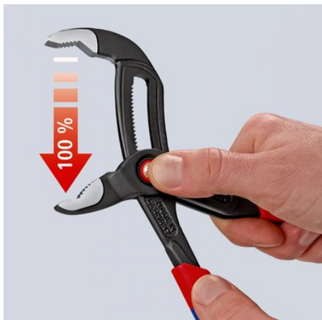
Nyomja meg a gombot, majd nyissa szét teljesen a fogót